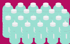
20 x 500 ml BOUTEILLES DE SOLUTION ACTIVE